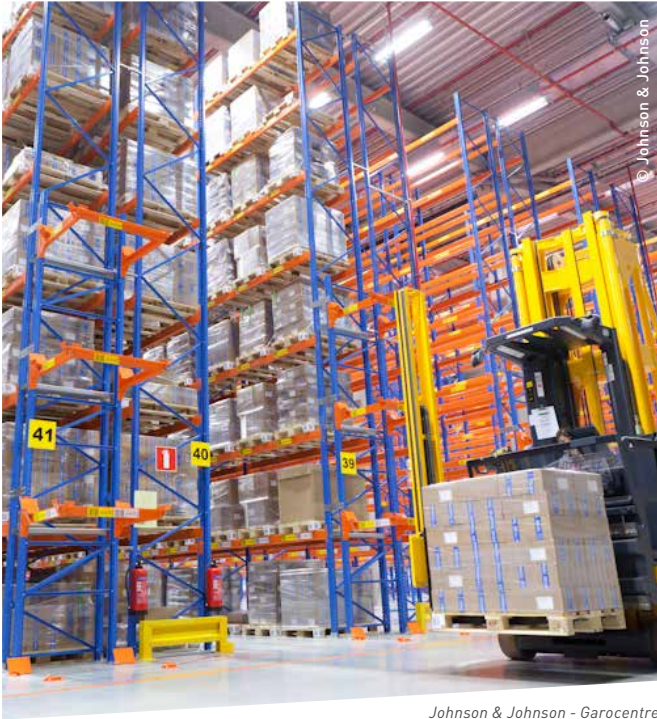
Johnson & Johnson - Garocentre