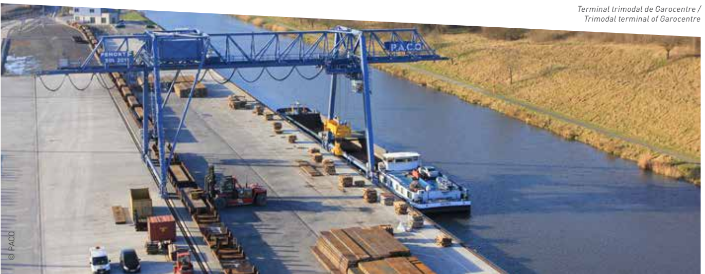
Terminal trimodal de Garocentre / Trimodal terminal of Garocentre