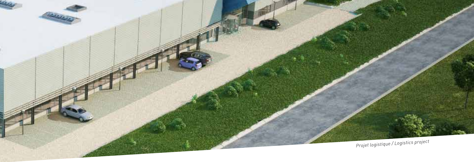
Projet logistique / Logistics project