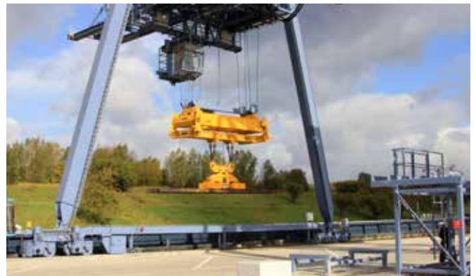
Port conteneurs de Garocentre / Garocentre containers port

IDEA is there to be your partner of choice at every step of your company's life cycle. Our aim is to make you welcome, to support and to back you, in your business project, when your business grows and throughout any subsequent developments.